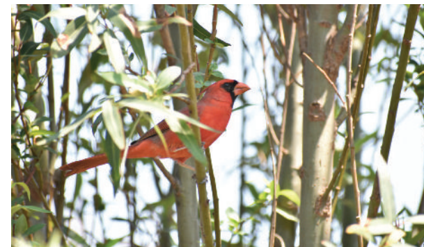
Cardinalis cardinalis Cardenal Rojo