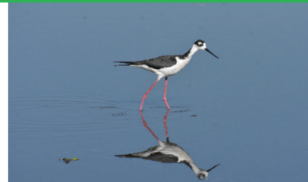
Himantopus mexicanus Monjita