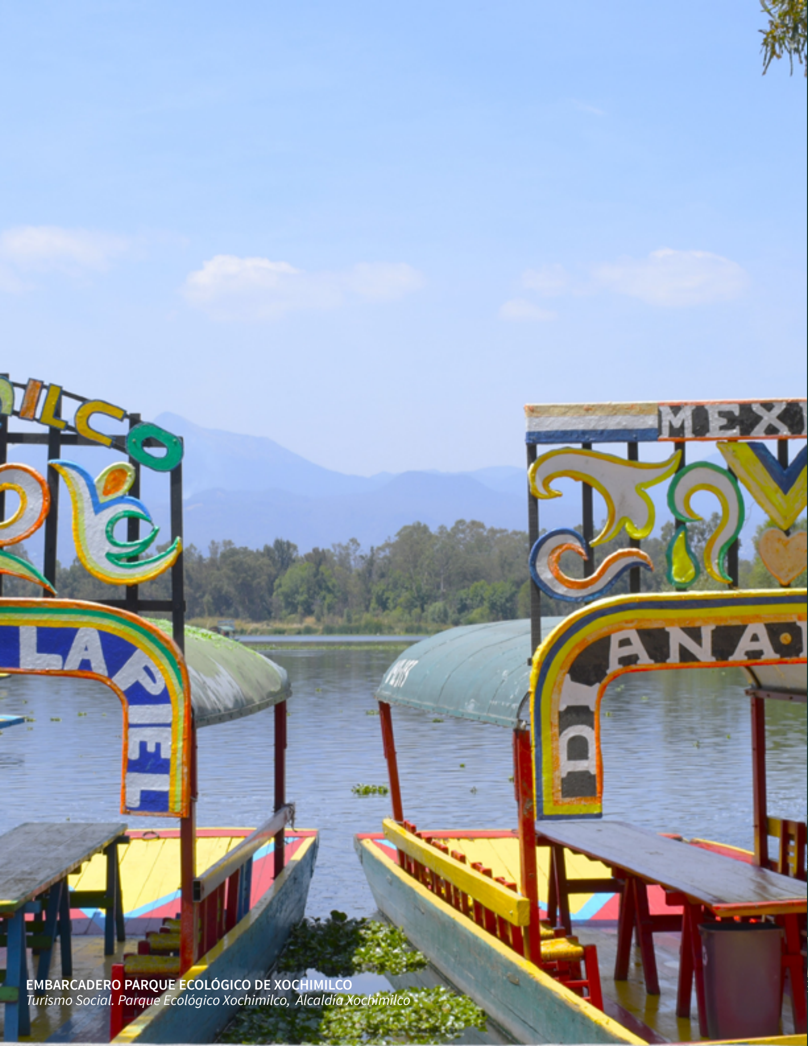
EMBARCADERO PARQUE ECOLÓGICO DE XOCHIMILCO Turismo Social. Parque Ecológico Xochimilco, Alcaldía Xochimilco