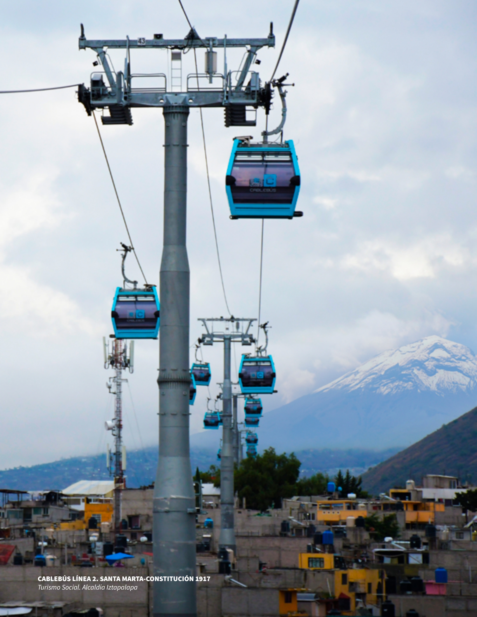
CABLEBÚS LÍNEA 2. SANTA MARTA-CONSTITUCIÓN 1917 Turismo Social. Alcaldía Iztapalapa