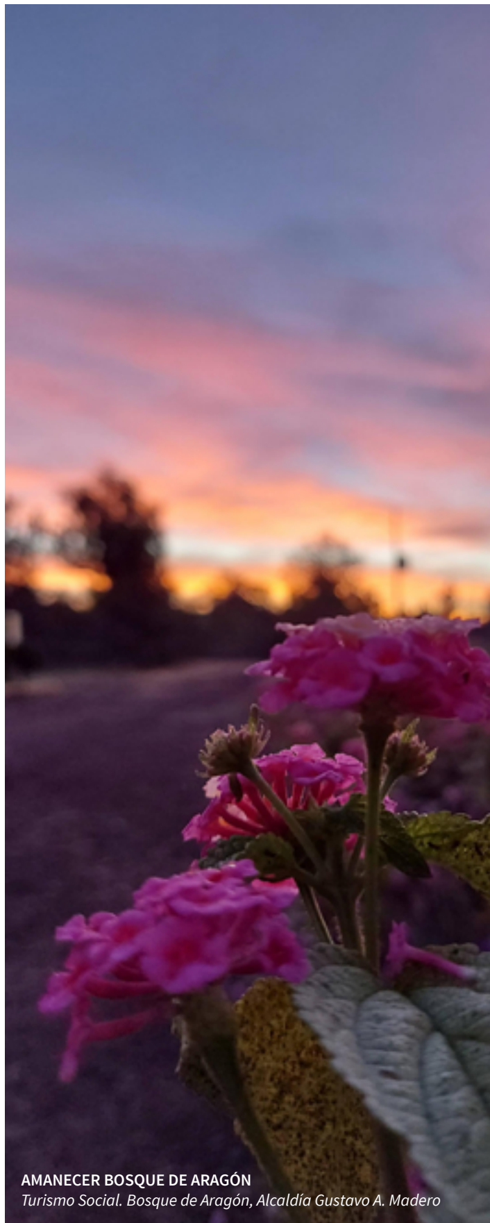
AMANECER BOSQUE DE ARAGÓN

Y las señaladas en la fracción XXXIV que a la letra dice: “generar, en coordinación con las dependencias competentes, los Servicios de Información Ambiental y Urbana de la Ciudad”; entre otras.