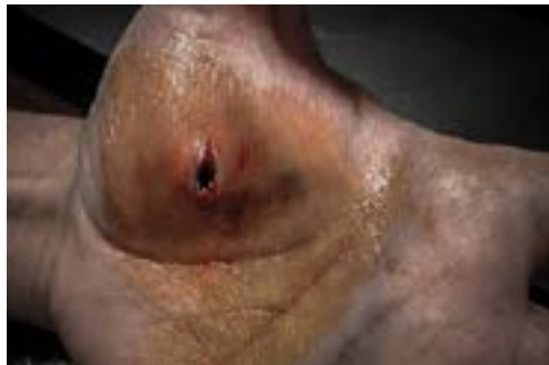
Imagen 4.3. Herida punzante

Producidas por objetos con punta, los bordes serán de forma irregular o regular dependiendo de la forma del objeto. (Imagen 4.3)