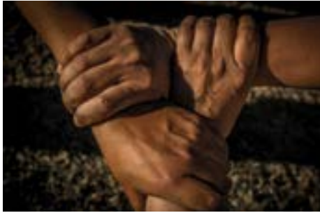
Imagen 6.2. Silla de tres manos.

Son utilizadas para víctimas fracturadas en una de las extremidades inferiores, no olvidar que ésta deberá estar inmovilizada preferentemente; la víctima debe de estar consciente.