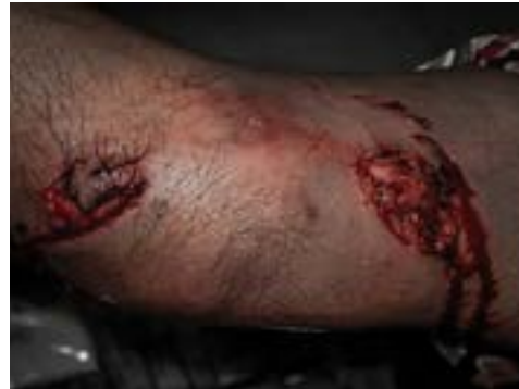
Imagen 4.2. Herida contusa

Causadas por los golpes con objetos sólidos de forma no específica, dejando bordes de forma regular e irregular. (Imagen 4.2)