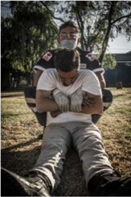
Imagen 6.5. Primer auxiliador sujeta brazos de la víctima.

Levantándolo de atrás hacia delante a la víctima se le sentará en el lugar en que se encuentra, el primer auxiliador pasará sus manos por debajo de las axilas de la víctima y tomando los antebrazos de ésta (Imagen 6.5). Lo sujetará firmemente hacia su tórax y levantarlo simultáneamente (Imagen 6.6), el segundo auxiliador cruzará extremidades pélvicas de la víctima y tomándolo de los tobillos que han quedado sobre el piso y levantará simultáneamente con el primer auxiliador, ambos caminarán de frente sacando a la víctima del área (Imagen 6.7).