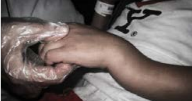
Imagen 5.1. Fractura cerrada.

Son aquellas en las que existen datos característicos de fractura pero no es posible observar el tejido óseo; se presenta dolor, deformidad, incapacidad funcional, inflamación y crepitación ósea (Imagen 5.1).