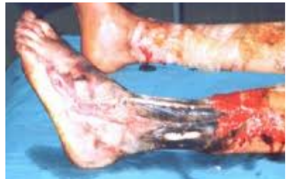
Imagen 4.11. Quemadura de espesor total (tercer grado).