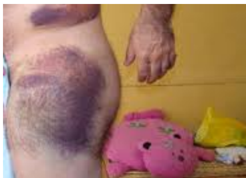
Imagen 4.5. Herida abrasiva

Causadas por fricción presentando bordes irregulares.