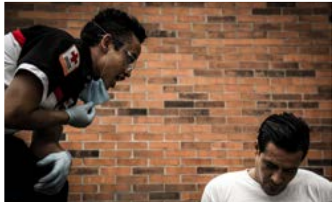
Imagen 1.6. Preséntese ante la víctima