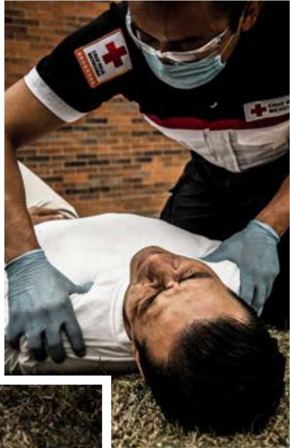
Imagen 1.8. Presión del músculo trapecio.

La respuesta esperada es que el paciente gesticule o se retraiga por el dolor.