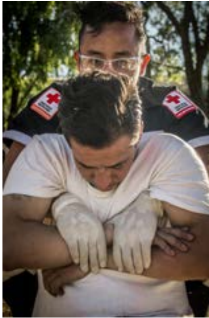
Imagen 6.6. Realiza el levantamiento de la víctima.