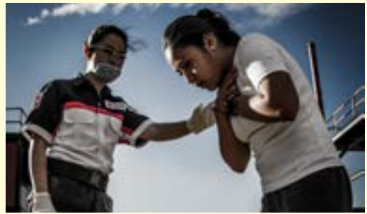
Imagen 2.1. Signo universal de atragantamiento.