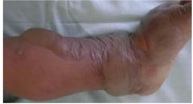
Imagen 4.10. Quemadura de espesor parcial de segundo grado.