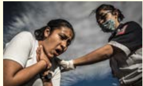
Imagen 2.3. Incentiva a la víctima a que siga tosiendo

Si puede hablar o toser con fuerza, dile a la persona que tú estás capacitado en primeros auxilios y que la vas a ayudar.