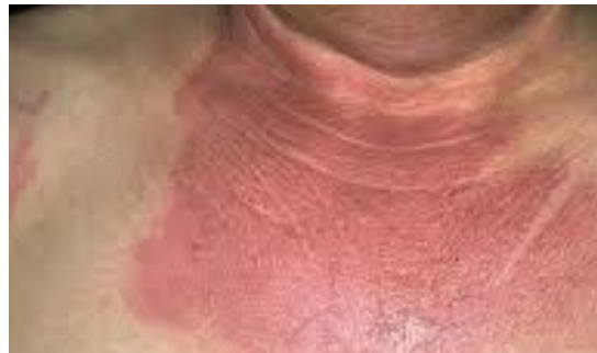
Imagen 4.9. Quemadura de espesor superficial.