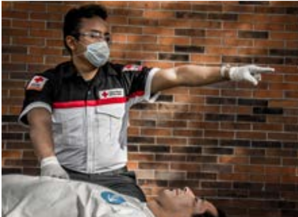
Imagen 1.10. Solicitud del SMU.

Es de vital importancia que en menor tiempo posible la víctima reciba atención médica definitiva. La puntual activación del SMU reduce significativamente el tiempo que pase un lesionado fuera del hospital. No dejes sola a la víctima, ayúdala de las personas que se encuentren a tu alrededor.