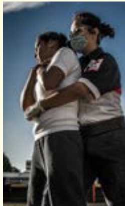
Imagen 2.2. Maniobra de desobstrucción de vía aérea.

Si NO puede hablar, respirar, ni toser con fuerza, dile a la persona que tú estás capacitado en primeros auxilios y que la vas a ayudar.