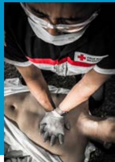
Imagen 2.4. Sitio para dar compresiones