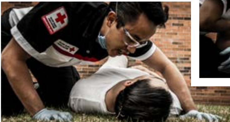
Imagen 1.7. Evalúe la respuesta verbal, a un costado de la víctima.