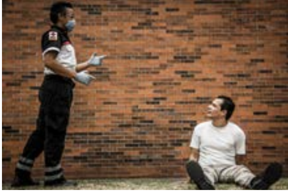
Imagen 1.5 Respuesta espontánea

cualquier estímulo del medio que lo rodea. Por ejemplo: si al acercarte al paciente voltea a verte al sentir tu presencia y te localiza espontáneamente, podrás identificarlo como "Alerta" . (Imagen 1.5).