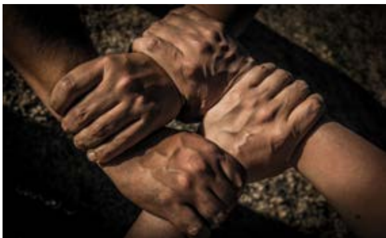
Imagen 6.1. Silla de cuatro manos.

Son utilizadas para transportar víctimas inconscientes o conscientes, con lesiones leves siempre y cuando los auxiliares puedan levantar a la víctima de acuerdo a su peso.