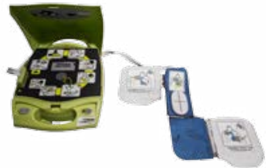
Imagen 2.5. Desfibrilador automática externo

La principal causa de un paro cardiopulmonar es la fibrilación ventricular, ésta se produce cuando el corazón por diferentes causas (principalmente por hipoxia) empieza a tener fallas en el sistema de conducción eléctrica ; en lugar que sea en un solo punto que arroje el impulso eléctrico en el atrio (aurícula), son varios al mismo tiempo y en los ventrículos, esto provoca que en el corazón en lugar de llevar un ritmo congruente se vuelve caótico y no puede expulsar la sangre que llega.