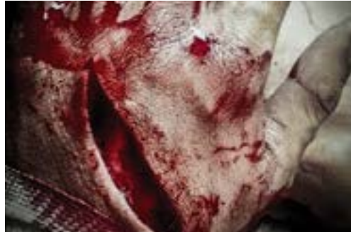
Imagen 4.4. Herida cortante

Causadas por instrumentos con filo, dejando sobre la piel borde regulares. (Imagen 4.4)