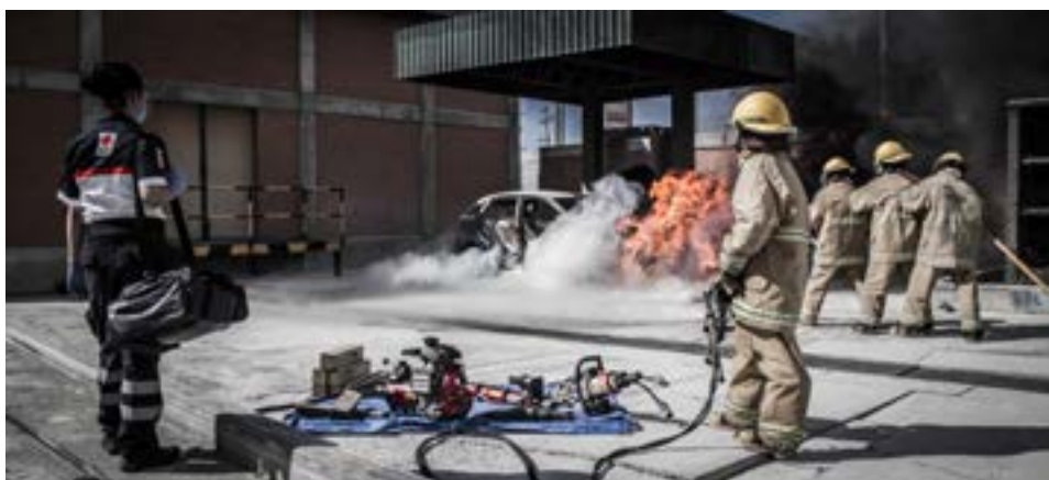
Imagen 1.4. Recursos adicionales

Con base en nuestra evaluación de la escena y los riesgos que encontramos podremos identificar la necesidad de mayores recursos. Estos recursos adicionales van encaminados a generar una escena más segura o mantenerla así. Dentro de estos recursos podremos contar con: Seguridad Pública, Bomberos, Cuerpos de Rescate, entre otros.