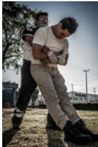
Imagen 6.4. Routeck por un elemento.