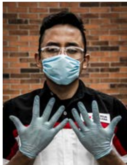
Imagen 1.1. Aislamiento a sustancias corporales (ASC).

Utiliza el equipo de protección mínimo: guantes de látex, lentes de seguridad y cubre bocas. Con lo anterior, se evitará que el accidente impida tu ágil intervención y en caso grave, atente contra tu salud y tu vida.