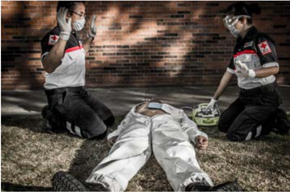
Imagen 2.7 No toque al paciente mientras se analiza o se brinda una descarga.