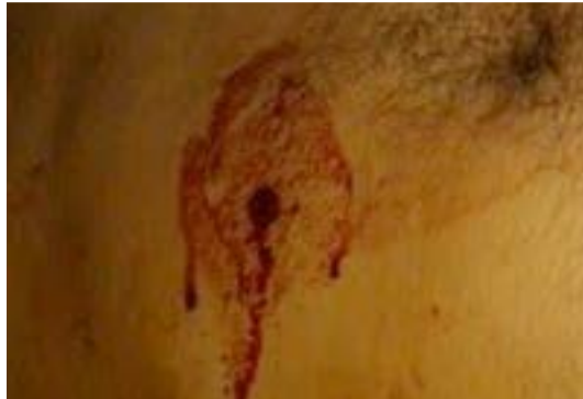
Imagen 4.1. Herida causada por proyectil de arma de fuego.