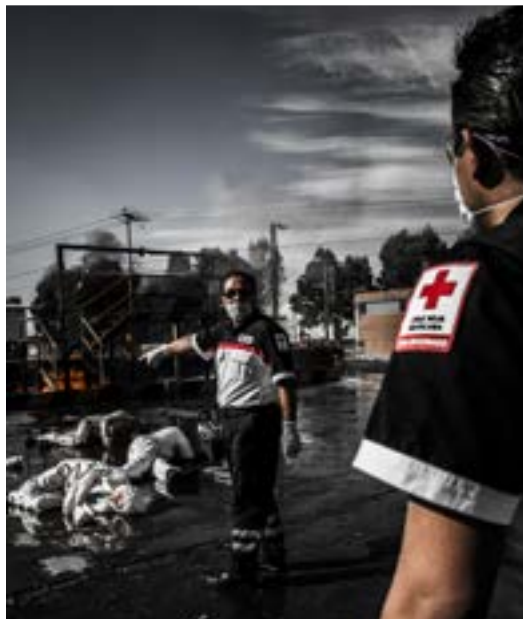
Imagen 1.3. Identificación de víctimas.

Como ya se hizo mención, además de la revisión de la escena es necesario determinar el número real de pacientes.