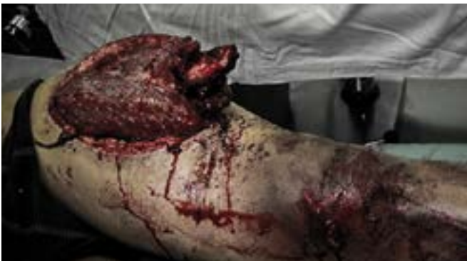
Imagen 5.2. Fractura expuesta

Son aquellas en donde el tejido óseo tiene contacto con el medio externo lesionando piel, músculos e incluso el paquete neurovascular (arterias, venas y nervios). (Imagen 5.2)