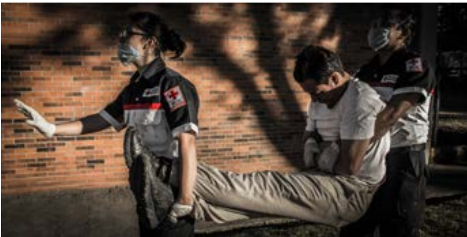
Imagen 6.7. Aplicación de Routeck por dos elementos.