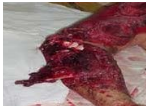
Imagen 4.6. Herida avulsiva

Son heridas que presentan colgajos de piel unidos al cuerpo por una de sus partes.