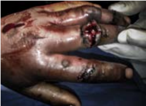
Imagen 4.1. Herida lacerante

Causadas por instrumentos sin filo, de superficie plana, los bordes son irregulares y salientes produciendo desgarramiento. (Imagen 4.1)