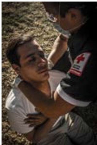
Imagen 6.3. Siente a la víctima.

A la víctima se le sentará en el lugar en que se encuentre (Imagen 6.3), el auxiliador pasa sus brazos por debajo de las axilas de la víctima y tomándose los antebrazos los sujetará fuertemente llevándolo hacia su tórax de esta manera levantándolo, lo sacará del área, caminando el rescatado hacia atrás (Imagen 6.4).