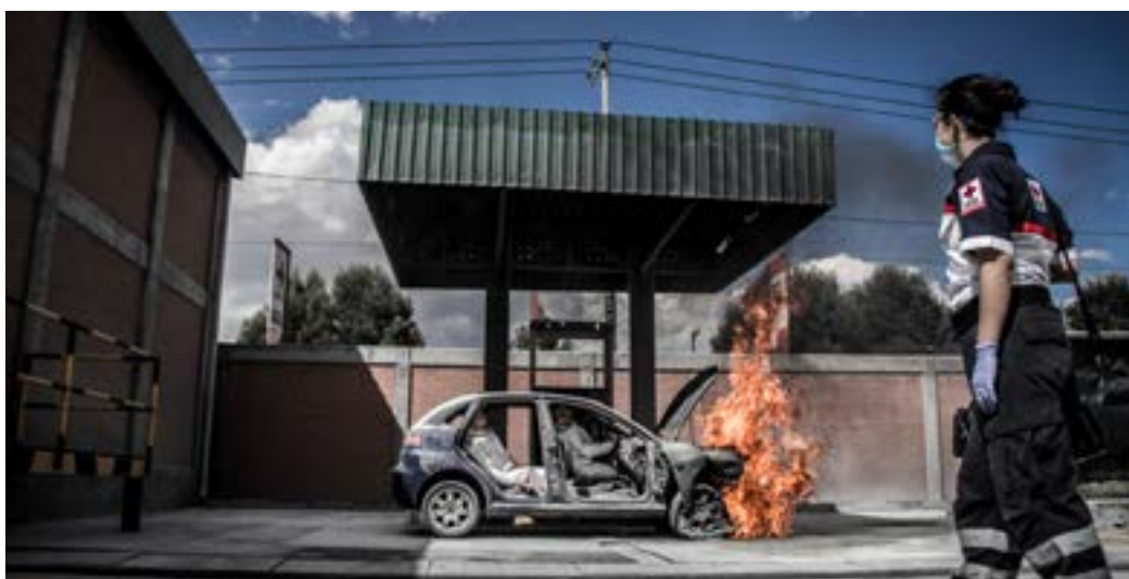
Imagen 1.2. ¿Qué huelo? ¿Qué observo? ¿Qué oigo?